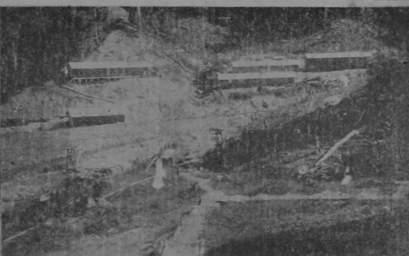
Vista de la última "Muela" de Quepos. — Amplios Campamentos para trabajadores. —